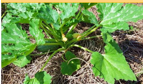
Courgette cultivée sur paillage

JauneCongo Sarl Site: jaunecongo.com Facebook: jaunecongo Instagram: jaunecongo