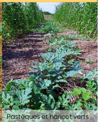
Pastèques et haricot verts