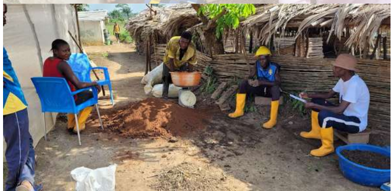
Puis la pratique : préparation des plants de maraîchage