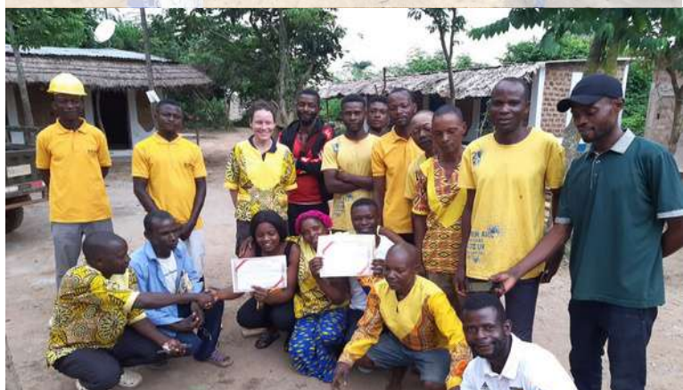
Remise de diplôme pour deux stagiaires de Lodja